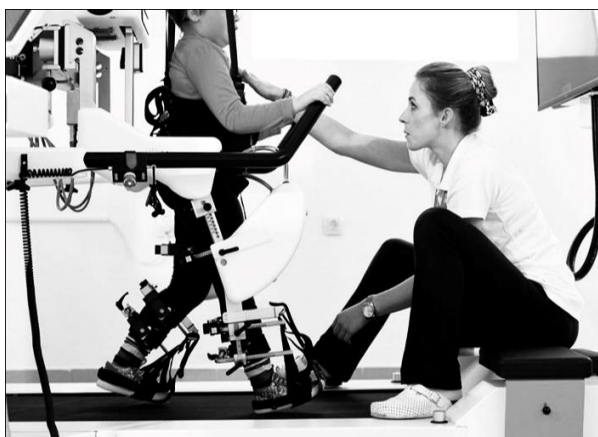
Slika 6. prikazuje terapiju pomoću robota