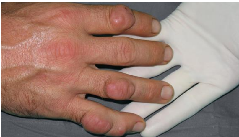
Slika 1. Prikaz šake zahvaćene reumatoidnim artritismom

Klinički tijek same bolesti nije predvidiv i bolest se često najbrže razvija u prvih šest godina od pojave prvih simptoma, a najveća progresija bolesti je u prvih godinu dana. Kod 80% oboljelih u prvih deset godina razvija se trajni deformiteti zglobova (Ivančević (ur.), 2010).