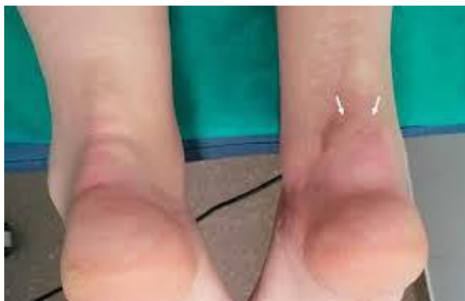
Slika 5. Prikaz entezitisa na Ahilovoj tetivi uzrokovanog psorijatičnim artritissom