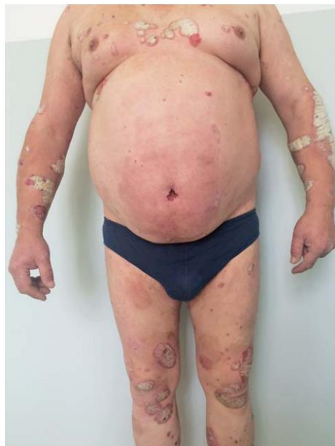
Slika 3. Prikaz vulgarne psorijaze

Psorijatične promjene se većinom javljaju bez simptoma ili u kombinaciji s blagim svrbežom. Najčešća mjesta na kojima se javljaju promjene su laktovi, koljena, sakrum, vlasište te genitalno područje. Mjesta na kojima se još mogu razviti promjene su obrve, nokti, aksilarno područje te područje oko pupka. Vulgarna psorijaza je najčešći oblik psorijaze i njene promjene se javljaju u obliku plaka koji je erimatozan i pokriven srebrnkastim ljuskicama (Ivančević (ur.), 2010).