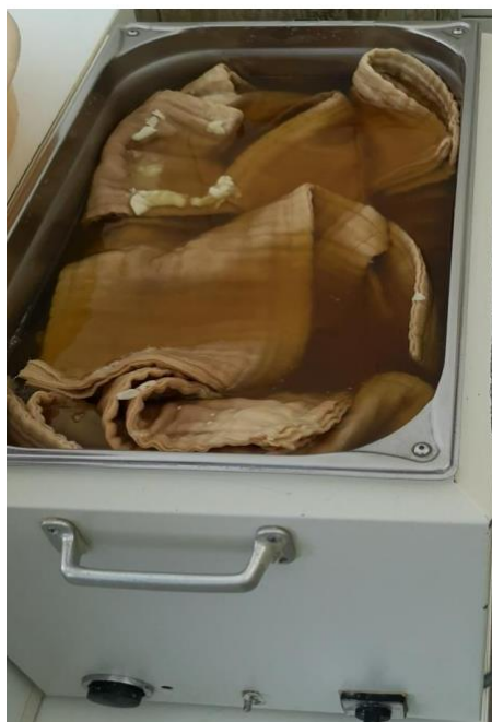
Slika 10. Prikaz mastikoterapije u obliku obloga