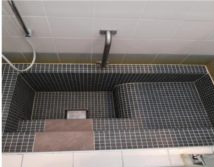
Slika 7. Prikaz naftalanske kade