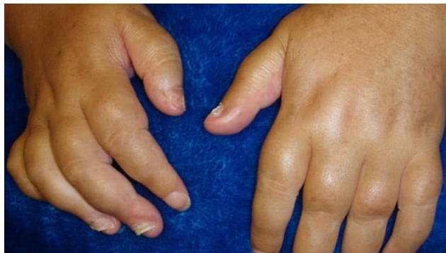
Slika 4. Prikaz daktilitisa uzrokovanog psorijatičnim artritissom

Upale na hvatištima ligamenata i tetiva nazivamo entezitis. Entezitisi su vrlo česti kod oboljelih od psorijatičnog artritisa, a najčešće mjesto njihove pojave je Ahilova tetiva, hvatišta mišića na laktu (epikondilitis) i zdjeličnim kostima i plantarna aponeuroza. Također u okviru kliničke slike psorijatičnog artritisa česte su i otekline mekog tkiva na prstima koje se još nazivaju i daktilitis ili „kobasičasti prsti“. Ovaj simptom prisutan je kod otprilike 50% oboljelih, a utječe na destrukciju samih zglobova (Schnurrer-Luke-Vrbanić i Laktasić-Žerjavić, 2017).