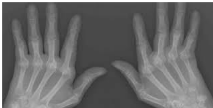
Slika. 2. Prikaz RTG snimka šaka zahvaćenih reumatoidnim artritisom

Radiološka dijagnostika je od velikog značaja u dijagnosticiranju reumatoidnog artritisa, a na rendgenskim snimkama su u početku uočljive otekline mekog tkiva i erozije na zglobovima. Laboratorijske pretrage su također dio dijagnostičke obrade, ali na temelju njih samostalno se ne može postaviti dijagnoza. Kod laboratorijskih pretraga bitna nam je pretraga sinovijalne tekućine i titar reumatoidnog faktora koji ako ga se identificira u visokim vrijednostima potvrđuje dijagnozu (Jajić, 1995).