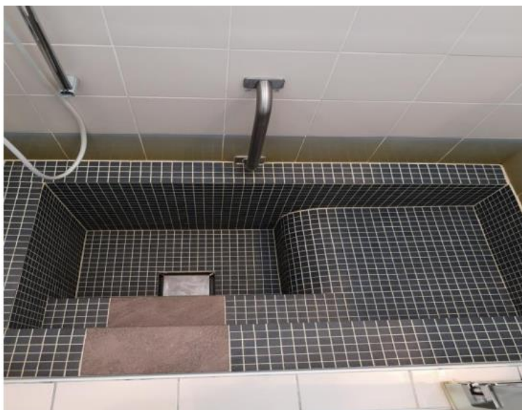
Slika 7. Prikaz naftalanske kade