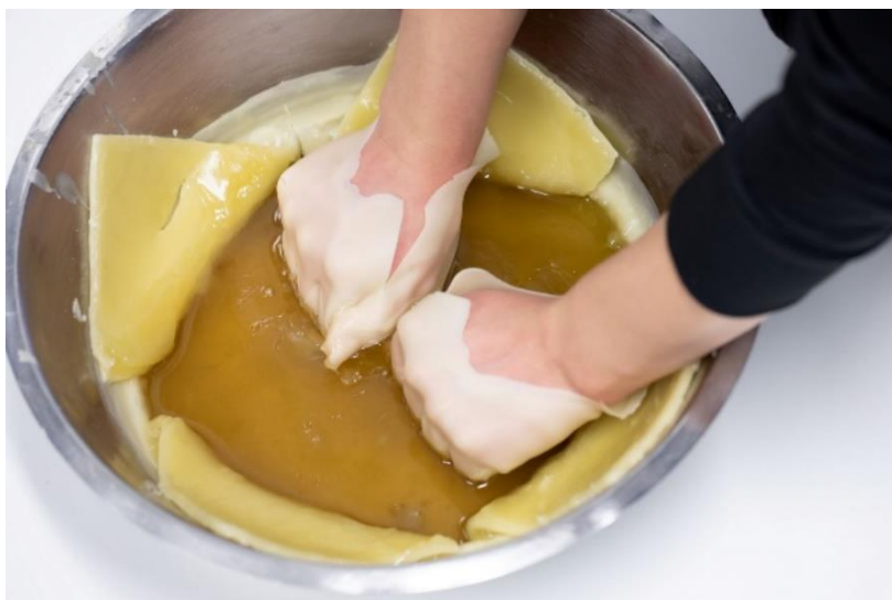
Slika 9. Prikaz mastikoterapije u obliku kupelji