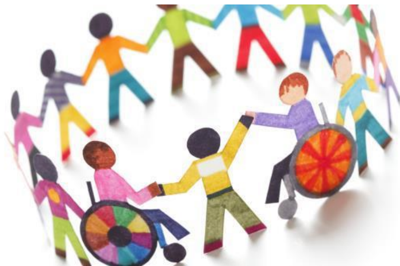
Slika 4. Prikaz integracije osoba s invaliditetom u socijalizaciju i društvo