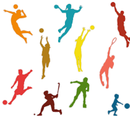
Slika 1. Vrste sportova

Sport može biti natjecateljskog ili slobodnog karaktera. Slobodni (amaterski) karakter je kada se sportaši bave sportom iz određenog razloga, a najčešće su to zdravstveni razlozi, npr. planinarenje koje je odlično za dišni sustav, a isto tako dobro djeluje i na mišićni i na krvožilni sustav čovjeka. Često se govori i olimpijskim sportovima, odnosno o sportovima koji su u programu ljetnih i zimskih olimpijskih igara, a govori se i o neolimpijskim sportovima (Enciklopedija.cc, 2021).