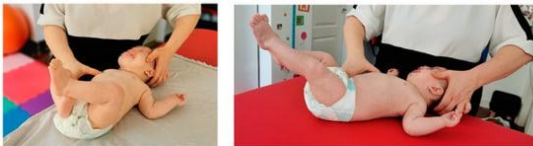
Slika br. 5 Prikaz prvog dijela kompleksa refleksnog okretanja kod djece

aktivira jer je prethodno već bilo aktivirano te sama aktivacija sada traje kraće, u prosjeku 10-15 sekundi (Parau i sur., 2023).