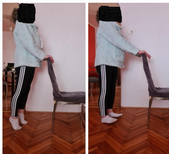
Slika 7. Primjer vježbe za ravnotežu

2. Stojeći položaj: podizati se na pete, zadržati par sekundi, spustiti se i zatim odizati na prste.