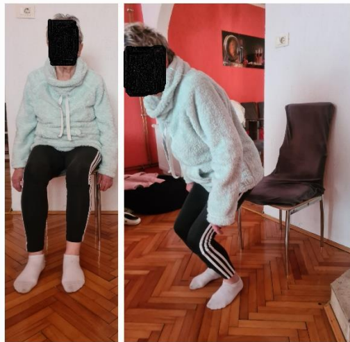
Slika 8. Primjer vježbe snage

1. Sjesti na stolicu uspravno. Polako se podizati iz sjedećeg položaja u stojeći bez držanja.