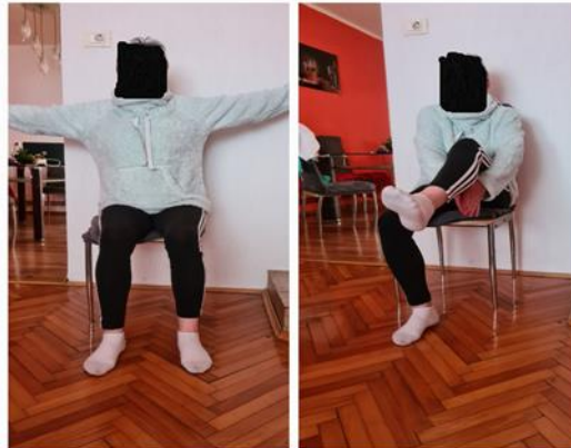
Slika 9. Primjer vježbe snage

2. Položaj je sjedeći na stolici s odručenim rukama. Podizati koljeno prema prsima, a istovremeno spojiti ruke ispod koljena.