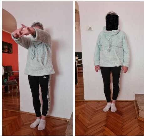
Slika 11. Primjer vježbe istezanja

2. Stojeći stav: spojiti ruke, prekrižiti prste i istegnuti ruke prema naprijed. Zadržati par sekundi i opustiti.