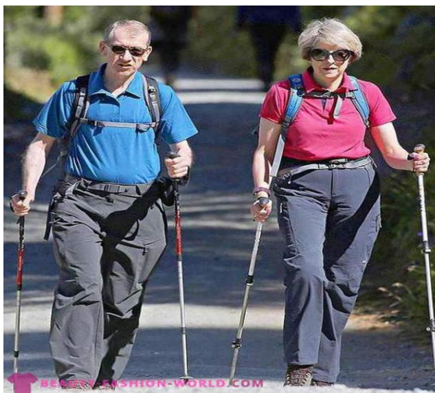
Slika 2. Prikaz nordijskog hodaња

Nordijsko hodaње je oblik fizičke aktivnosti gdje je prirodno hodaње unaprijeđeno dodavanjem aktivnom upotrebom posebno konstruiranih štapova za takav oblik hodaња. Korištenje štapova uključuje gornji dio tijela u hodaње što izaziva rad različitih mišićnih skupina, a uključivanje većeg broja mišića uzrokuje i veću energetska potrošnju. Osim toga, kod nordijskog hodaња povećava se kondicija srca i pluća, dolazi do suzbijanja stresa, smanjuje se opterećenje donjih dijelova tijela što je bitno kod osoba koje imaju problema sa zglobovima (Gomenuka i sur., 2019).