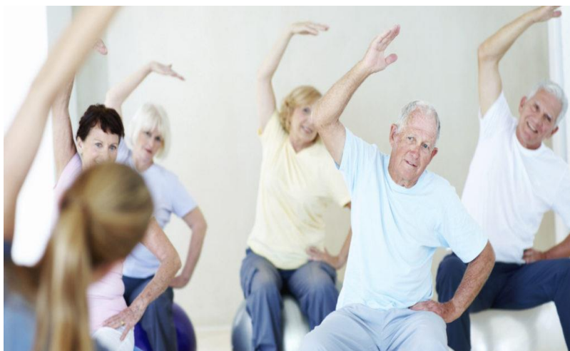
Slika 5. Prikaz rekreativne tjelovježbe kod starijih osoba

Kombinacija svih navedenih vježbi je djelotvorna, jer povećava fleksibilnost, smanjuje mišićnu napetost, poboljšava koordinaciju i ravnotežu, poboljšava cirkulaciju, povećava mišićnu snagu (Maček i sur., 2017).