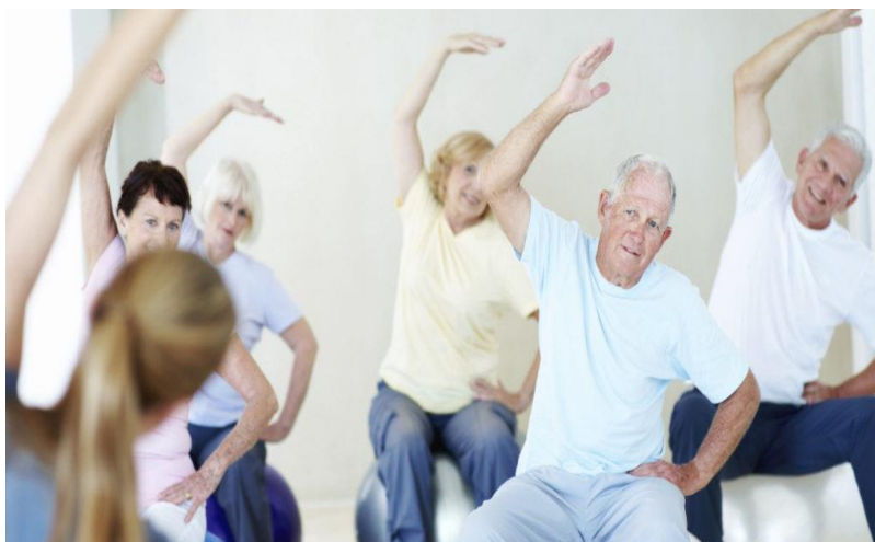
Slika 5. Prikaz rekreativne tjelovježbe kod starijih osoba