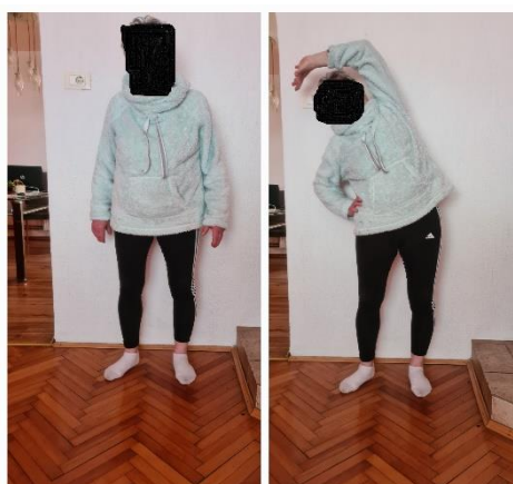
Slika 10. Primjer vježbe istezanja

1. Stojeći položaj: jednu ruku staviti na kuk, druga ruka je u zraku. Polako se s tijelom naginjati u jednu stranu i zadržati taj položaj par sekundi, nakon toga ponoviti isto na drugu stranu.