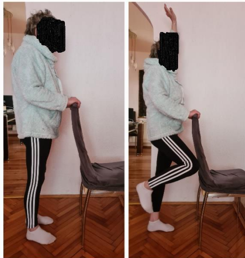
Slika 6. Primjer vježbe za ravnotežu

1. Jednonožno stajanje: stati uspravno i podići jednu nogu od poda i suprotnu ruku. Držati ravnotežu koliko god je moguće, zatim spustiti nogu i ruku te isto ponoviti s drugom stranom.