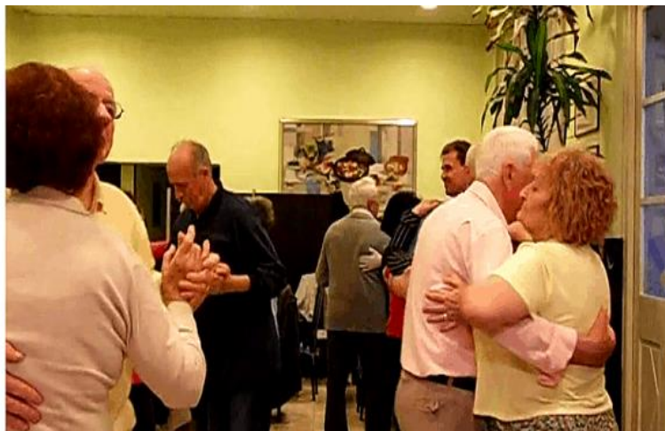
Slika 4. Prikaz socijalne dobrobiti plesa

Osim tjelesne dobrobiti, ples poboljšava socijalnu dobrobit. Ples kod starijih osoba doprinosi osobnoj dobrobiti i društvenim vezama te poboljšava njihovo samopouzdanje. Pomaže starijim ljudima da postanu kreativniji i autentičniji i da dožive smisao pripadnosti određenoj skupini. Ples kod starijih ljudi izaziva sreću, potiče ljubav prema sebi, smanjuje se depresija i stres te se poboljšava kvaliteta sna (Slika 4) (Štambuk i Tomičić, 2020).