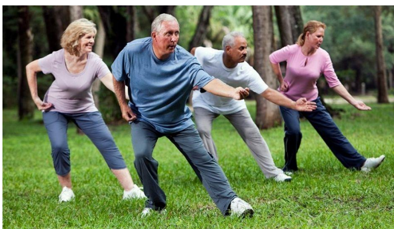
Slika 3. Prikaz jedne od vježbi u Tai Chi

Neke od prednosti Tai Chi vježbi kod osoba starije dobi su: poboljšanje ravnoteže i smanjenje rizika od pada, povećanje fleksibilnosti i jačanje mišića, smanjenje stresa i poboljšanje mentalnog zdravlja, poticanje koordinacije i koncentracije te socijalna interakcija.