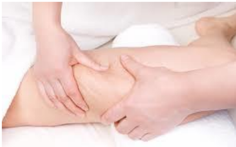
Slika 5. Zahvat gnječenja.