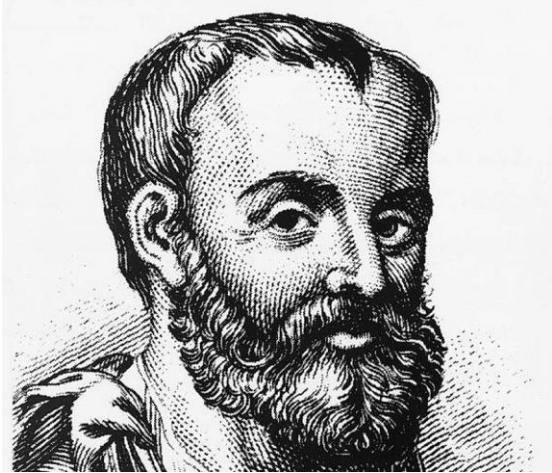
Slika 2. Galen (129. - 200).