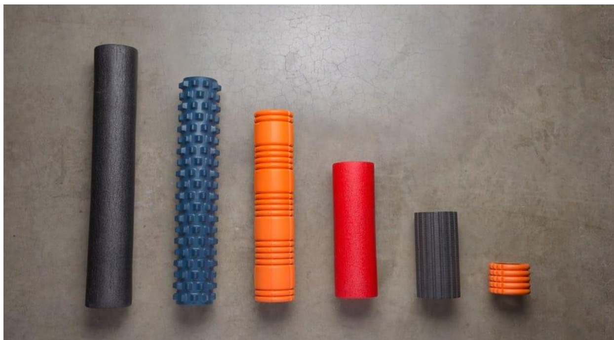
Slika 8. Vrste pjenastih valjaka za samomasažu.