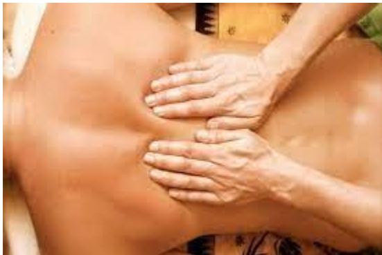
Slika 4. Zahvat glađenja. Preuzeto sa: