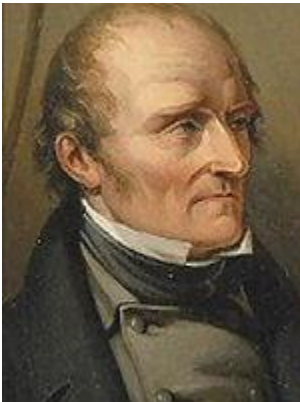
Slika 3. Per Henrik Ling (1776-1839).Preuzeto sa: