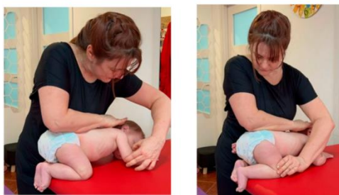
Slika br. 7 Lijevo je prikaz stimulacije u dvije točke, desno prikaz stimulacije u tri točke

Stimulacija se može izvoditi podraživanjem u dvije točke ili u tri točke oslonca. Stimulacija u dvije točke oslonca na strani lica se podražuje medijalni epikondil humerusa, a na strani potiljka se podražuje zona pete. Područje medijalnog epikondila humerusa se podražuje 10-15 sekundi kada se počine aktivirati donji ekstremitet na strani potiljka čime se postiže reverzna supinacija i inverzija abduciranih metatarzalnih kostiju uz fleksiju prstiju. Za donji ekstremitet na strani lica položaj je everzijski s abduciranim metatarzalnim kostima i ekstenzijom prstiju. Stimulacija u tri točke oslonca se izvodi na istom principu kao i stimulacija u dvije točke. Koriste se podražaji na ista mjesta na tijelu djeteta, tj stimulira se medijalni epikondil humerusa na strani lica i vrh pete na strani potiljka i kao treća stimulacija je područje aponeuroze gluteusa. Odgovor na stimulaciju dobiva se pokretanjem tibije na strani lica i donjeg ekstremiteta na strani potiljka. Prsti izvode fleksiju, a donji ekstremitet na strani lica dolazi u srednji položaj. Naizmjeničnom aktivacijom gornjih i donjih ekstremiteta dobiva se obrazac refleksnog puzanja. Aktivacije se ponavljaju 3 puta na svakoj strani (Parau i sur., 2023).