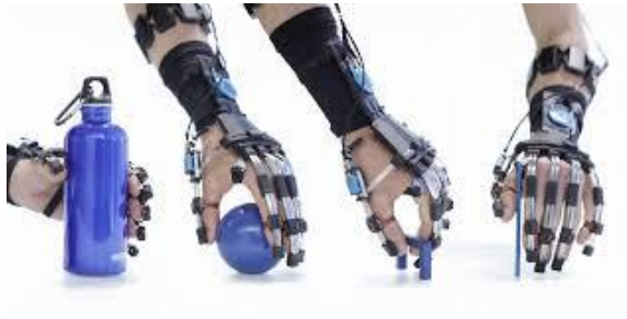
Slika br. 3 Prikaz kidPEXO egzoskeleta

Dostupno na: ( https://exoskeletonreport.com/product/armeospring-pediatric/ )