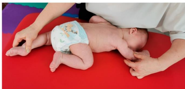
Slika br.6 Prikaz kompleksa refleksnog puzanja

Dostupno na: ( https://www.mdpi.com/1648-9144/59/10/1883 )