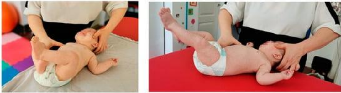
Slika br. 5 Prikaz prvog dijela kompleksa refleksnog okretanja kod djece

aktivira jer je prethodno već bilo aktivirano te sama aktivacija sada traje kraće, u prosjeku 10-15 sekundi (Parau i sur., 2023).