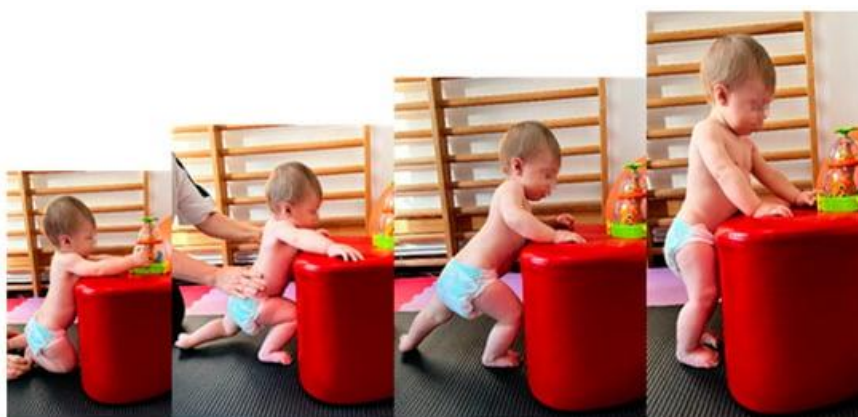
Slika br. 4 eng. "Servant Knight" pozicija