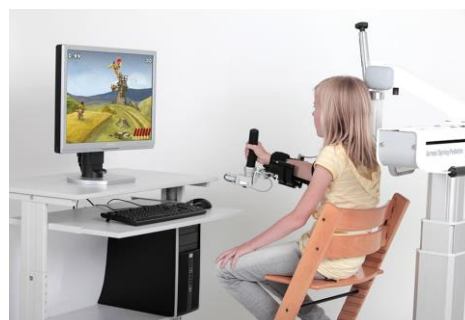
Slika br. 2 Prikaz ArmeoSpring egzoskeleta

Intervencije robotske tehnologije uključuju primjenu ArmeoSpring egzoskeleta koji pruža pasivnu potporu gornjim ekstremitetima i potiče pokrete u ruci kroz video igre. Na ovaj način se potiče samostalnost pacijenta i motivacija za izvođenje pokreta. Primijećena su poboljšanja u mjerama funkcije gornjih ekstremiteta nakon 4 tjedna rehabilitacije ovom tehnologijom (Hart i sur., 2022). Drugi uređaj, kidPEXO poboljšava bimanualnu izvedbu pokreta ruke. Ovaj uređaj omogućuje hvatanje cijelom šakom, aktivnu izvedbu fleksije i ekstenzije kažiprsta, srednjeg prsta, prstenjaka i malog prsta zajedno i palca odvojeno, te djetetu daje mogućnost izvođenja različitih hvatova poput snažnog, preciznog i lateralnog ili bočnog hvata (Lieber i sur., 2022).