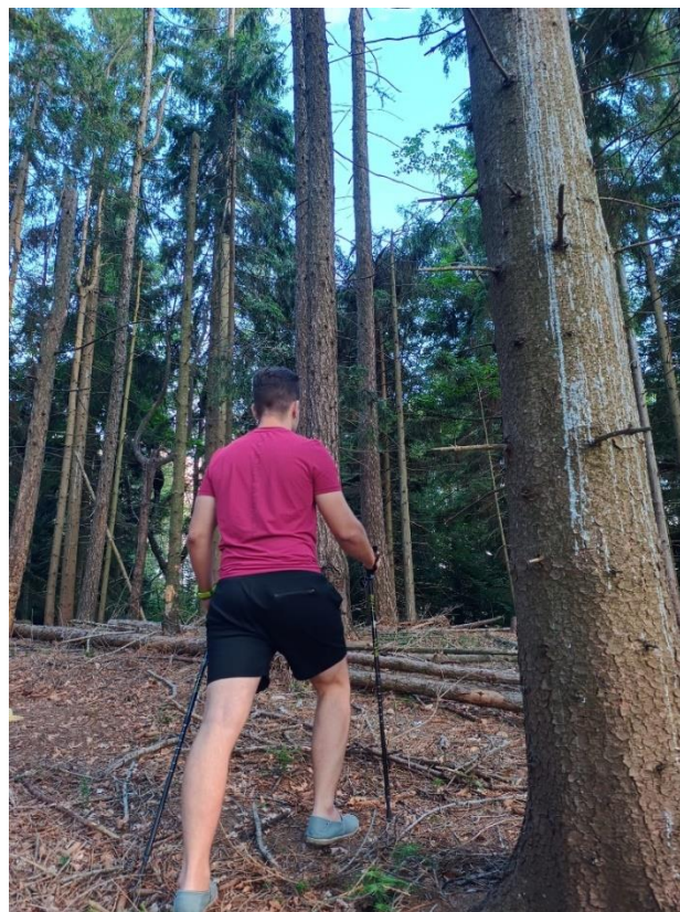
Slika 4. Nordijsko hodanje u prirodi

aerobnog vježbanja, ljudsko tijelo koristi glikogen i mast kao gorivo. Maksimalno se povećava količina kisika u krvi, broj otkucaja raste povećavajući protok krvi u mišiće i natrag u pluća. Kako se disanje pojačava, ugljični dioksid se izbacuje iz tijela. Osim jačanja kardiovaskularnog sustava, sudjelovanje u redovitom provođenju aerobnih aktivnosti ima brojne zdravstvene prednosti kao npr. povećanje izdržljivosti i smanjenje umora tijekom i nakon vježbanja, aktivacije imunološkog sustava, podiže raspoloženje, poboljšava cirkulaciju i pomaže tijelu bolje korištenje kisika, pomaže smanjiti rizik od razvoja dijabetesa te pomaže u smanjenju stresa, napetosti, tjeskobe i depresije. Vrste aerobnih vježbi uključuju trčanje ili jogging, hodanje posebnim tempom, plivanje, veslanje, vožnju biciklom, penjanje uz stepenice, ples, korištenje kardio sprava poput trake za trčanje. Provođenje navedenih aerobnih oblika vježbi i aktivnosti od velike je koristi za zdravlje ljudi. Međutim, prije započinjanja aerobnih vježbi osobe koje imaju neko kardiovaskularno stanje trebale bi razgovarati sa stručnjakom smiju li uopće i ako smiju, koliko često mogu provoditi aerobne vježbe (Aydin, 2022). Jedan od primjera aerobne tjelesne aktivnosti je slobodno nordijsko hodanje u prirodi (Slika 4).