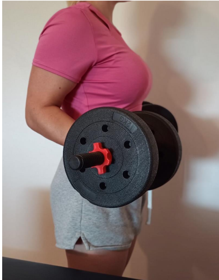
Slika 5. Trening snage pomoću utega

Osim vježbi joga, preporuča se provođenje treninga snage koji uključuje korištenje utega ili bučica ili vlastite tjelesne težine za izgradnju mišićne mase. Povećanje mišićne mase pomaže sagorijevanju viška kalorija u mirovanju čime se postiže održavanje optimalne tjelesne težine (Sands, Wurth i Hewit, 2012).