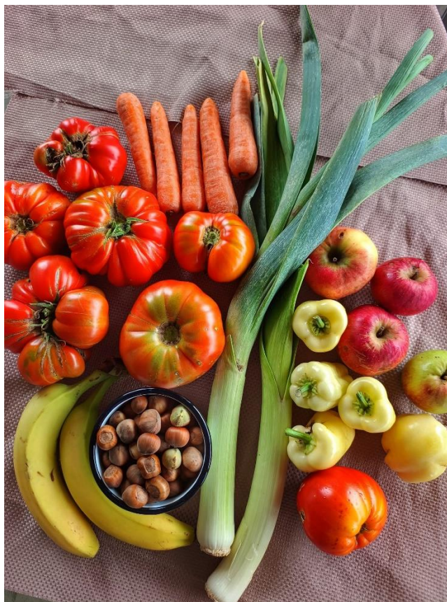
Slika 3. Primjer zdrave i raznovrsne prehrane