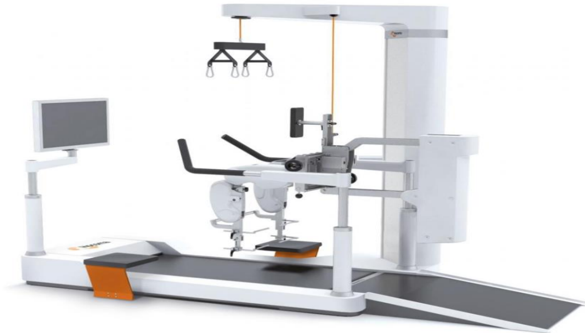
Slika 1. Lokomat Pro