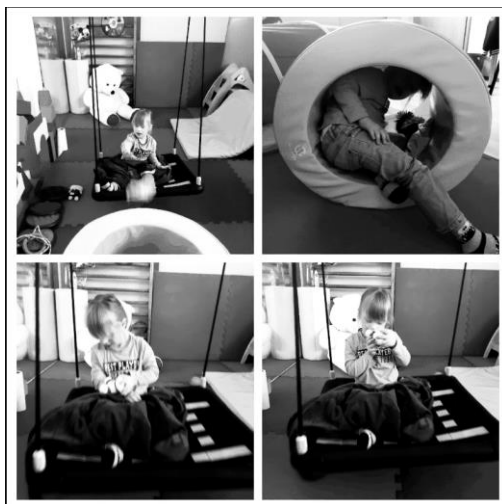
Slika 5. prikazuje terapiju senzorne integracije

Ciljevi terapije senzorne integracije uključuju poboljšanje senzorne obrade, integracije i regulacije, što može rezultirati poboljšanjem pažnje, koncentracije, motoričkih funkcija, socijalnih vještina i samostalnosti u svakodnevnim aktivnostima. Važno je napomenuti da se terapija senzorne integracije provodi pod nadzorom obučenog terapeuta. Terapeut će prilagoditi terapijski plan i tehnike prema individualnim potrebama i mogućnostima djeteta. Terapija se obično provodi kroz redovite sesije s terapeutom, a roditelji i skrbnici mogu biti uključeni kako bi podržali napredak djeteta kod kuće (Pfeiffer B., 2011).