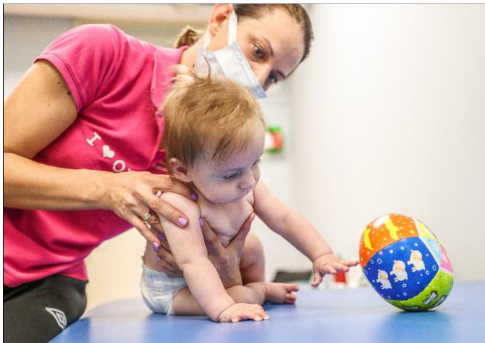
Slika 3. prikazuje Bobath terapiju

Ciljevi Bobath terapije uključuju poboljšanje motoričke kontrole, ravnoteže, koordinacije, snage mišića i pokretljivosti. Terapeut radi na razvoju normalnih pokreta i funkcionalnosti kako bi dijete postalo što samostalnije i funkcionalnije u svakodnevnim aktivnostima. Važno je napomenuti da se Bobath terapija prilagođava individualnim potrebama i mogućnostima djeteta. Terapeut će izraditi individualizirani terapijski plan koji odgovara specifičnim potrebama i ciljevima djeteta (Winnie Dunn, 2002).