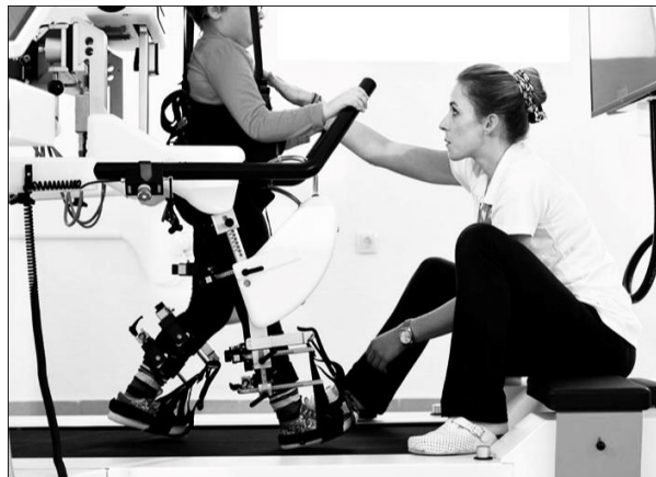
Slika 6. prikazuje terapiju pomoću robota