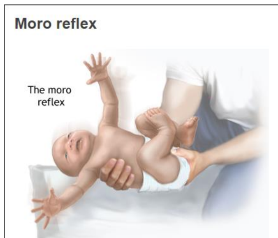
Slika 1.: prikazuje Moro refleks

U razdoblju između 1. i 2. mjeseca djetetova života, karakterističan je položaj mačevaoca. U ovom položaju, djetetova glava je okrenuta prema predmetu koji ga zanima, a na istoj strani se nalazi ispružena ruka s otvorenom šakom i palcem prema van. Također, na istoj strani se nalazi i ispružena noga, dok su suprotna noga i ruka savijene (flektirane). Ovaj položaj omogućava djetetu da istražuje svoju okolinu i usmjerava svoju pažnju prema interesantnim predmetima. Ovaj položaj je dio normalnog motoričkog razvoja u tom razdoblju i pokazuje napredak u kontroli glave, ruku i nogu. (V. Matijević, 2015).