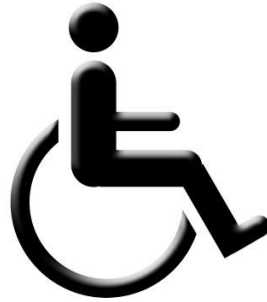
Slika 3. Osoba s invaliditetom