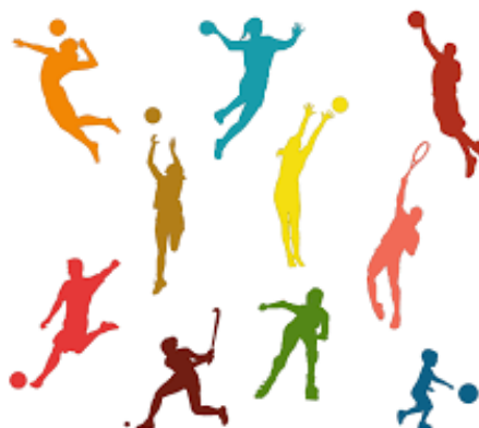
Slika 1. Vrste sportova

Sport može biti natjecateljskog ili slobodnog karaktera. Slobodni (amaterski) karakter je kada se sportaši bave sportom iz određenog razloga, a najčešće su to zdravstveni razlozi, npr. planinarenje koje je odlično za dišni sustav, a isto tako dobro djeluje i na mišićni i na krvožilni sustav čovjeka. Često se govori i olimpijskim sportovima, odnosno o sportovima koji su u programu ljetnih i zimskih olimpijskih igara, a govori se i o neolimpijskim sportovima (Enciklopedija.cc, 2021).