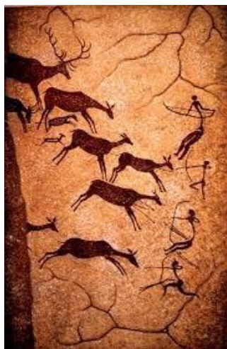
Slika 2. Los Caballos, Španjolska, 10 000 – 9000 g.pr. Kr.