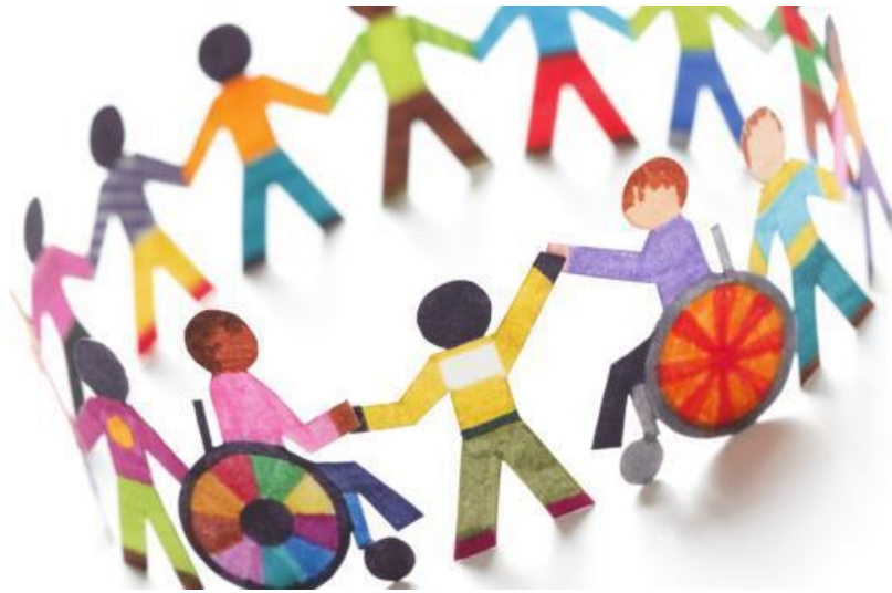
Slika 4. Prikaz integracije osoba s invaliditetom u socijalizaciju i društvo