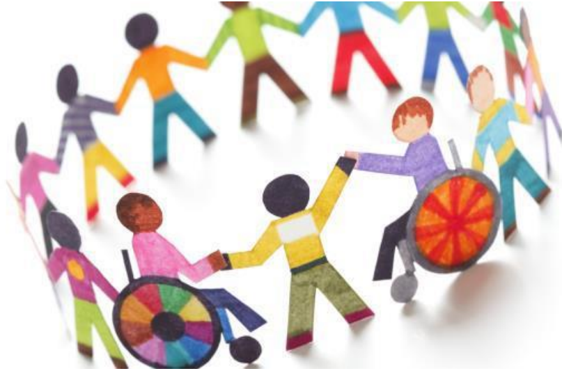
Slika 4. Prikaz integracije osoba s invaliditetom u socijalizaciju i društvo

važno uključiti aktivnosti kao što je informiranje, edukacija i konstantno bavljenje sportskim aktivnostima (Dolenec, 2017).