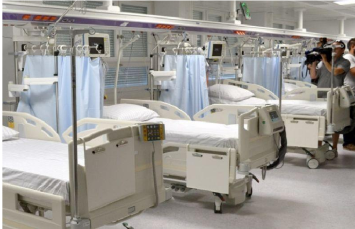
Slika 6, prikaz jedinice za neurokiruršku intenzivnu njegu.

Medicinska sestra provodi njegu osobne higijene pacijenta u krevetu, a podrazumijeva djelomičnu i kompletnu zdravstvenu njegu. Medicinska sestra procjenjuje: opće stanje i stanje svijesti kod pacijenta, mogućnost suradnje, postojanje komplikacija za planirani postupak (Prlić N, 2009). Također medicinska sestra procjenjuje pacijentovu mogućnost samostalnog hranjenja i odijevanja. Važno je da medicinska sestra prati pacijentovo stanje, te da obavještava liječnika o prisustvu boli i određenih poteškoća kako bi se mogla dati primjerena terapija za stanje.