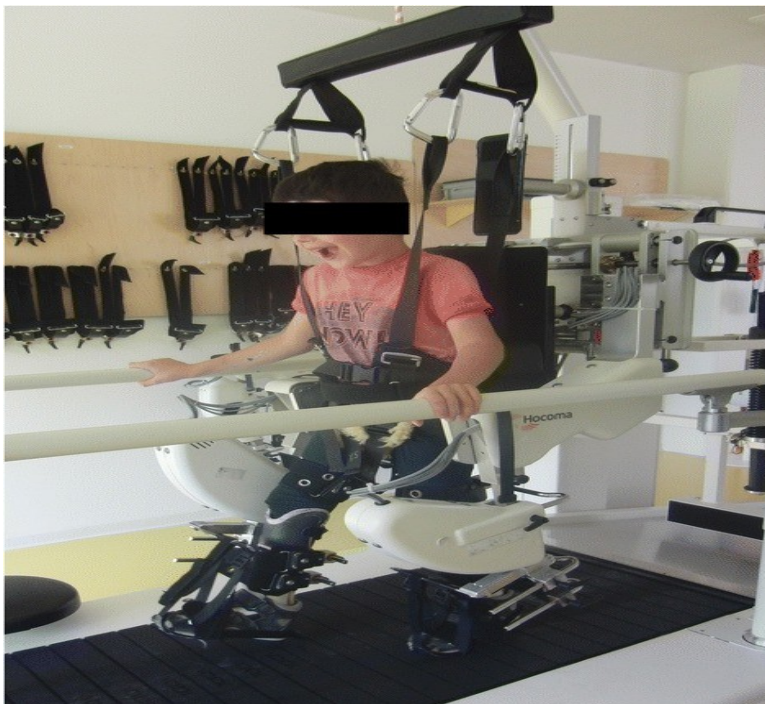
Slika 6. Lokomat

Istraživanje provedeno 2017. godine dokazuje kako Lokomat uređaj doprinosi mobilnosti i samostalnosti pacijentu. Također, pozitivno utječe na spastičnost i ravnotežu (Nam, Kim, Kwon, Park, Lee, Yoo, 2017).