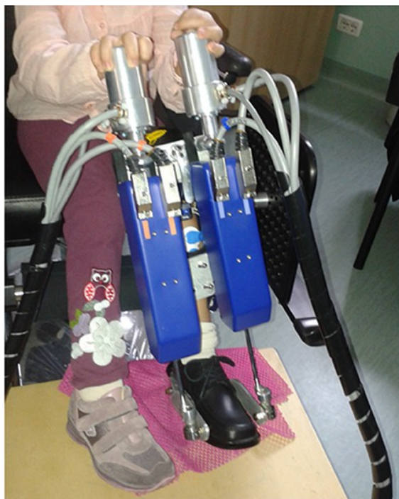
Slika 5. dijete s CP-om koristi PediAnklebot

Dostupno na: https://biomedical-engineering-online.biomedcentral.com/track/pdf/10.1186/s12938-021-00920-5.pdf