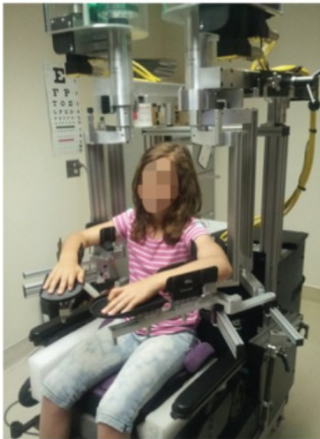
Slika 4. robot KINARM

Dostupno na: https://biomedical-engineering-online.biomedcentral.com/track/pdf/10.1186/s12938-021-00920-5.pdf