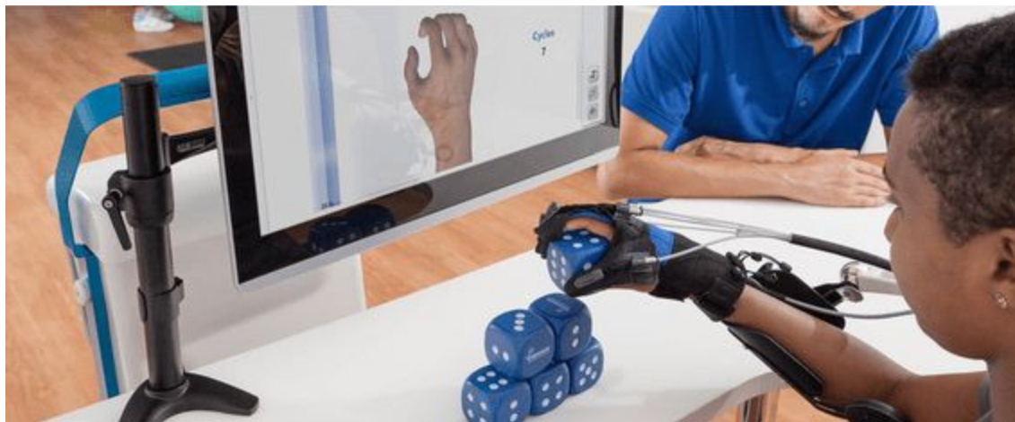
Slika 7. Gloreha robot

prstiju i prema preostalim motoričkim sposobnostima, djelomično ili potpuno podržava pacijenta. Pacijent može koristiti svoju zdravu ruku da odgovori sličnim pokretima na zahvaćenoj ruci preko robotske rukavice. Gloreha Sinfonia se između ostalog koristi za početak funkcionalnog oporavka, jer pacijentova ruka nema smetnju i može se slobodno pomicati; dostupne su lateralne i bilateralne vježbe. Tijekom terapije mogu se koristiti stvarni predmeti. Unutar Gloreha softvera dostupno je nekoliko postavki, poput video pregleda, prilagodljive vokalne upute, praćenje poboljšanja performansi i interaktivne igre. Istraživanje koje je provedeno 2020. godine na 7 pacijenata koji su kroz 12 sesija ( 2 tretmana tjedno) koristili Gloreha uređaj pokazalo je da uporaba gloreha robota pozitivno utječe na strukturu i funkciju distalnog djela ruke (Kuo, Lee, Hsaio, Lin, 2020).