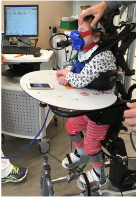
Slika 3. dinamičko stajanje u Innowalk-u

Dostupno na: https://www.researchgate.net/figure/Dynamic-standing-device-Innowalk-A-Technical-drawing-of-the-Innowalk-B-The-Innowalk_fig2_333844676