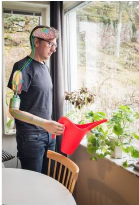
Slika 2. ilustracija robotske protetike u svakodnevnicima

Robotska protetika (slika 2.) je relativno nova primjena robota koja se koristi u medicinske svrhe. Usredotočuje se na pružanje povećanju funkcionalnosti udova. Iako su proteze s robotskim mogućnostima već dostupne na tržištu, one ostaju skupe za pacijente jer se ova tehnologija tek počela razvijati. Jedan primjer napretka u ovom području su neuromuskuloskeletne proteze (Middleton, Ortiz-Catalan, 2020).