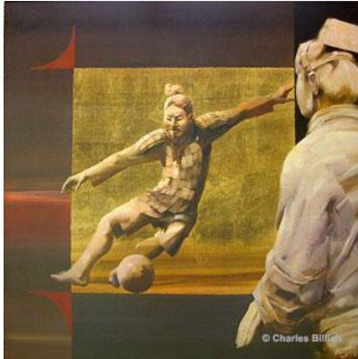
Slika 1. Tsu Chu