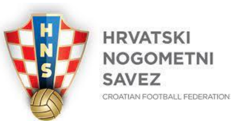
Slika 3. HNS

Krovna organizacija nogometa u Hrvatskoj je HNS (Hrvatski nogometni savez), s logom prikazanim na slici 3., osnovan 1912., nakon neovisnosti, a potvrđeno članstvo od strane glavne svjetske organizacije za nogomet FIFA-e 1993. Predsjednik HNS-a je Marijan Kustić.