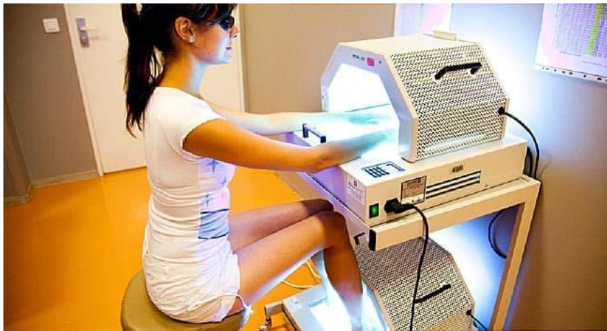
Slika 5. Prikaz jednog od načina fototerapije

Osim vježbi, ostale procedure koje se mogu koristiti je ultrazvuk kroz vodu ukoliko na koži ne postoje rane od psorijaze ili su rane otvorene. Ako dođe do boli kod pacijenta, primjenjuje se TENS (transkutana električna stimulacija). Fototerapija je važna kod ove vrste bolesti zbog postojanja psorijaze, a njeni učinci su vidljivi u smanjenju kožnih promjena (slika 5). Provodi se u posebnim kabinama koje su opremljene svjetiljkama koje emitiraju UVB zrake određenih valnih duljina koje određuju osobe namijenjene za fizikalnu terapiju.