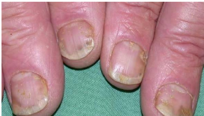
Slika 1. Prikaz promjena na noktima kod psorijaze i psorijatičnog artritisa

Što se tiče promjena na zglobovima, uvijek nastupaju asimetrično, a dijele se u blage i teške. Kod teških promjena nastupaju destrukcije kostiju te naboranje kože i skraćivanje prstiju. Osim zglobova, javljaju se i promjene na noktima. Nokti postaju krhki, lomljivi, žuti, debeli i bolni na dodir (slika 1). Uz sve navedene promjene, javlja se daktilitis i entezitis te SAPHO sindrom. Pod SAPHO sindromom podrazumijevamo sinovitis, akne, palmoplantarnu pustulozu, hiperostoza i osteitis.