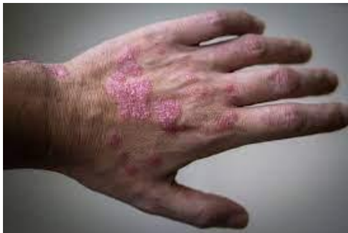
Slika 4. Prikaz nastalih plakova tijekom psorijaze

Za sve kožne promjene koje se pojavljuju pribrajaju se psorijazi. Ona može biti vulgarna, inverzna, eruptivna i generalizirana pustularna psorijaza, palmoplantarna pustuloza te eritrodermija. Najčešća od nabrojanih koja se pojavljuje u 90% slučajeva je vulgarna psorijaza. Kod takve psorijaze dolazi do nastajanja plakova (slika 4) koji su prekriveni srebrnim ljuskama. Najčešća mjesta na kojima je vidljivo su ekstenzorni dijelovi udova, vlasište, lumbosakralno područje i periumbilikalna regija. Plakovi se mogu spajati te prekriti veće površine kože.