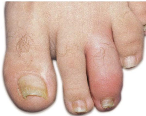
Slika 2. Prikaz daktilitisa nastalog na prstima stopala

Daktilitis kod psorijatičnog artritisa predstavlja difuznu upalu prstiju, a značajan je za sve skupine spondiloartritisa. Pojavljuje se u obliku oteklina mekog tkiva, a posljedica je upale zglobova - DIP, PIP, MCP ili MTP te afekcije tetivne ovojnice fleksora i mekog tkiva prstiju. Zbog oteklina, često se upala naziva i „kobasičasti prst“ te može nastati na šakama i stopalima, ali je češća pojava na stopalima (slika 2). Pojavom oteklina javlja se ograničen opseg pokreta, bol na palpaciju i crvenilo zahvaćenog prsta. Dijagnosticira se kliničkim pregledom, a mjerni instrument kojim se određuje opseg zahvaćenog prsta naziva se „Leeds Dactylitis Instrument“-LDI (Žužul, 2019).