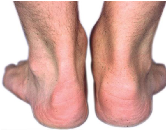
Slika 3. Prikaz entezitisa Ahilove pete (desna peta)

Dostupno na: https://revma-info.si/tveganje-za-psoriaticni-artritis/