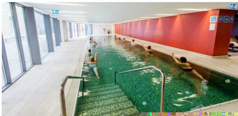
Slika 6. Prikaz balneoterapije – Rimske terme